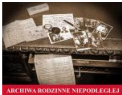
ARCHIWA RODZINNE NIEPODLEGŁEJ [2] _ [2]