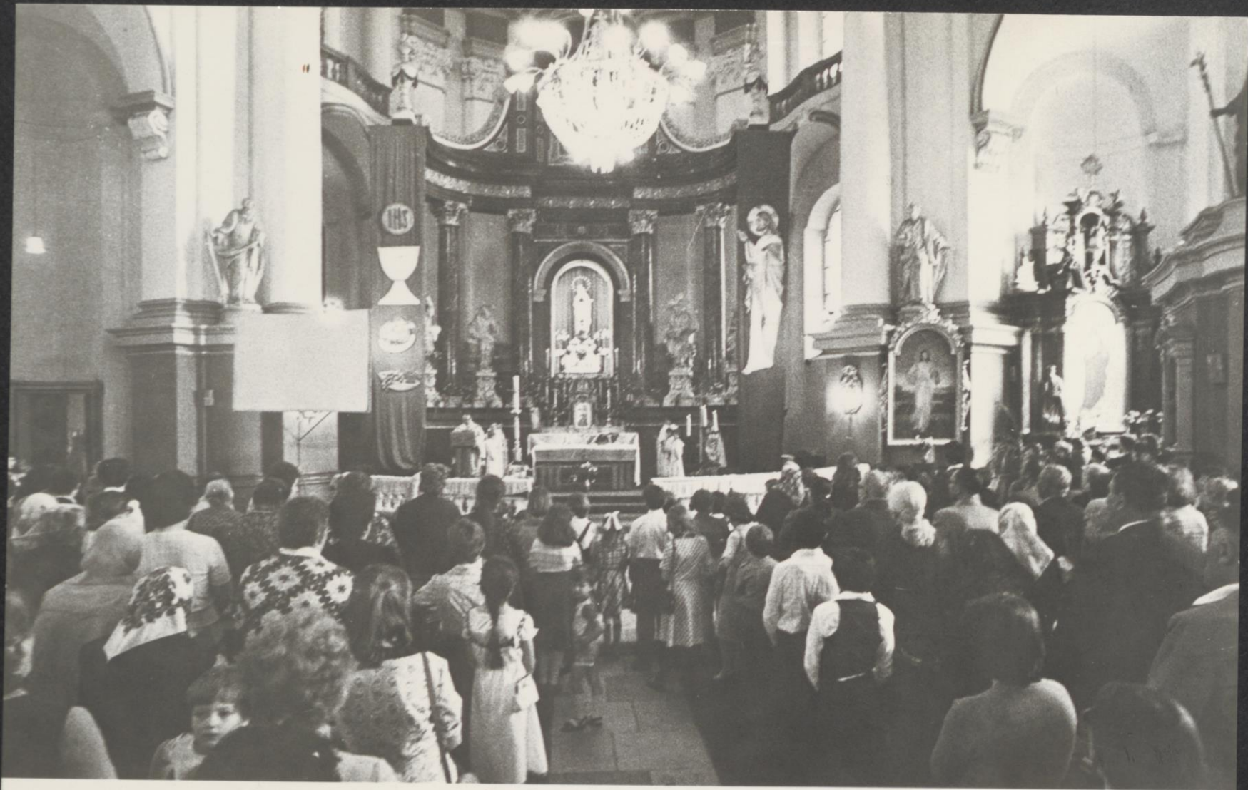
Po zgonie Prymasa Polski, kardynała Stefana Wyszyńskiego w całym województwie legnickim odprawiono msze żałobne. Wierni zgromadzili się też w legnickim kościele Św. Jana